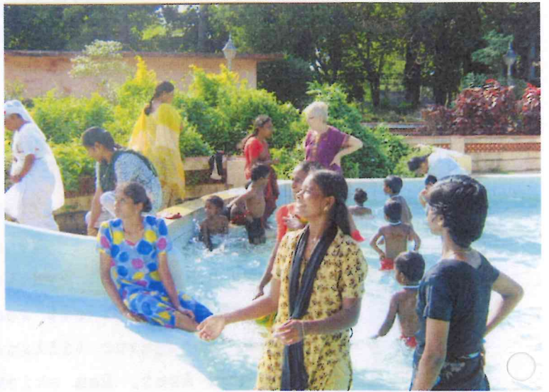
Bilder från utflykt till "The Garden"